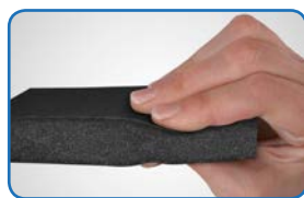
Den integrerade ytan ger optimal friktion